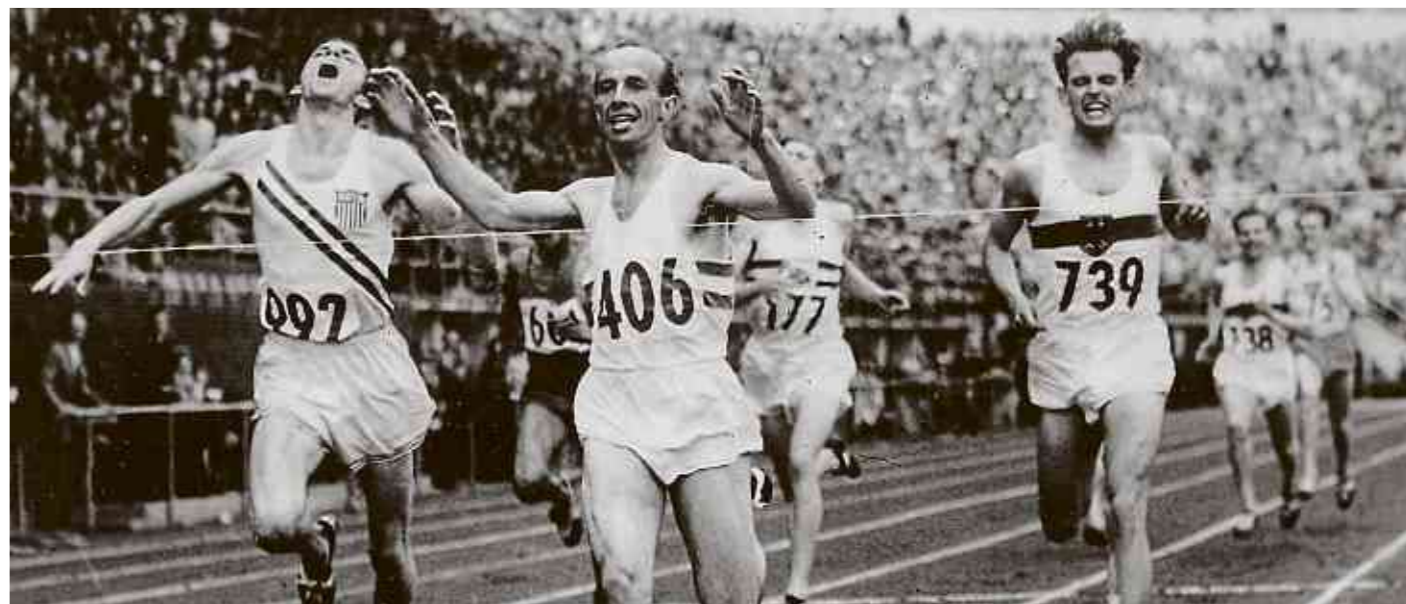
Überraschung geschafft: Josy Barthel lief bei den Olympischen Spielen in Helsinki das Rennen seines Lebens. Der Luxemburger gewann die Goldmedaille über 1500 m.

gust 1951 kam es in Trier zum ersten Nachkriegsvergleich zwischen Deutschland B und Luxemburg. Das FLA-Team unterlag mit 44:112.